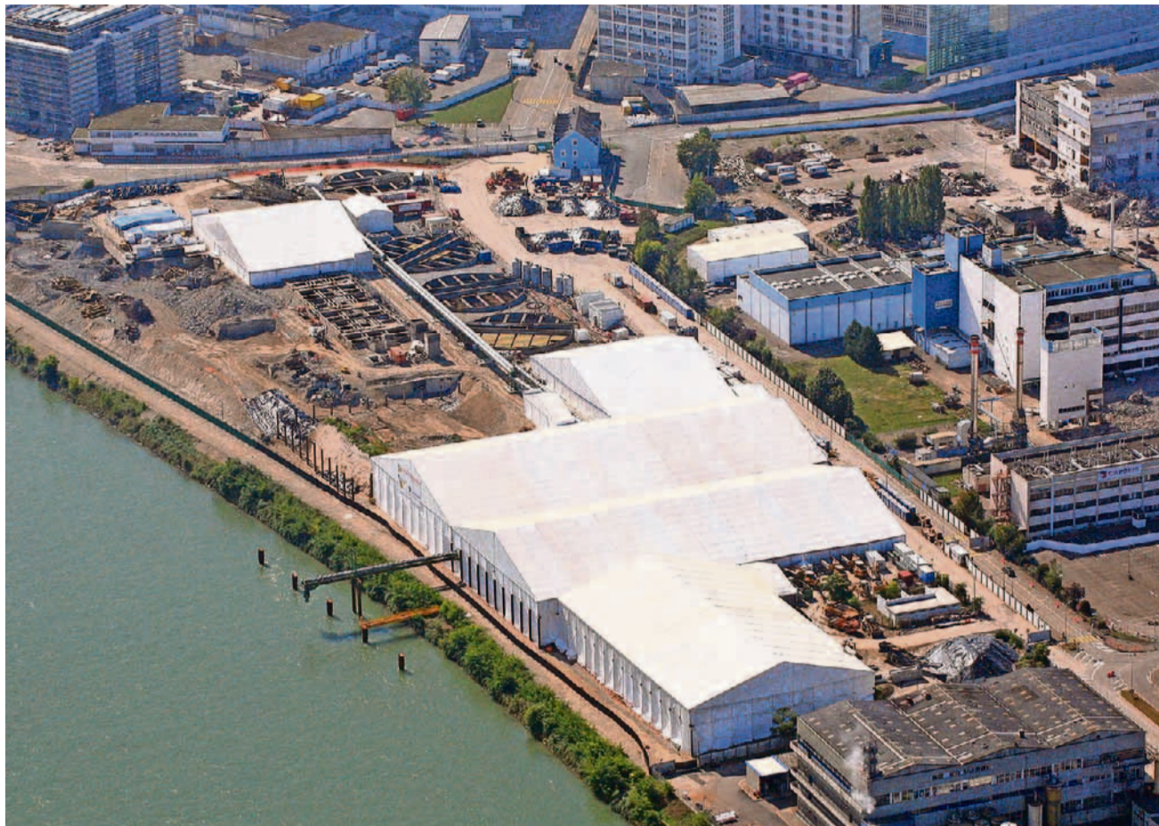
In den weissen Zelten wird die belastete Erde vor dem Weitertransport zwischengelagert.