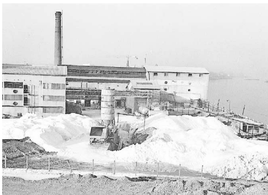
Usine Kuhlmann lagerte Lindan 1972 im Freien.